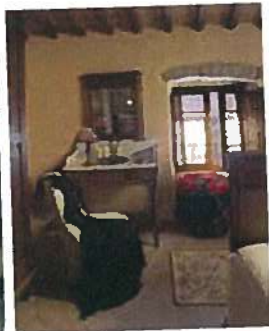
BORGO DI VAGLI