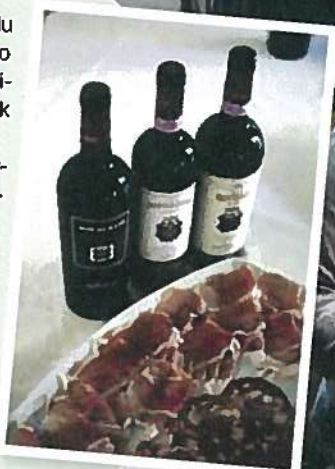
GODE PÅ MAT: Vin og spekemat er typisk fingermat over store deler av Italia, men særlig i Toscana.

Den lokale trattoriaen, uansett hvor du er, blir aldri feil. I området rundt Borgo di Vagli er det flere byer med gode spisesteder. Ett av de bedre ligger faktisk på landet, på vingården Avignonesi ( www.avignonesi.it ). Le Capezzine serverer fenomenale femretters lunsjmåltider – selvsagt med ypperlig vin til. Osteria le Logge i Siena ( www.gianni-brunelli.it ) holder høy klasse og har vunnet flere priser for sitt kjøkken. I Cortona bør du sjekke ut Osteria del Teatro ( www.osteria-del-teatro.it ), som har klassiske, toskanske retter på menyen, med råvarer fra gårdene rundt.