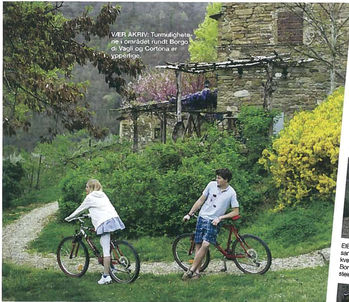
VÆR AKRIV: Turmulighetene i området rundt Borgo di Vagli og Cortona er ypperlige.