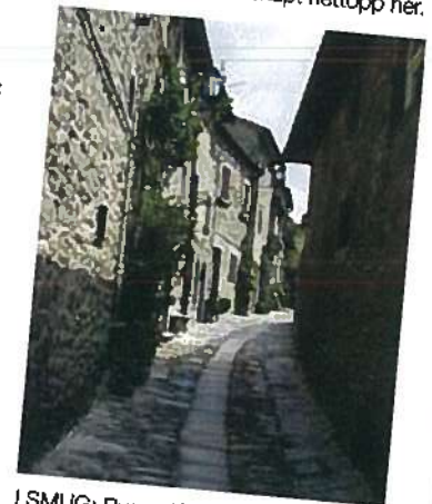
I SMUG: Byene i Toscana preges ofte av sine smale smug, som dette karakteristiske bratte i Cortona.

H vilken livsglede! Under en rødmande vintersol tar grusveien oss forbi vingårder og markene som omkranser dem. Rundt oss synger fuglene ivrig forventningsfulle. Ellers er det behagelig stille.