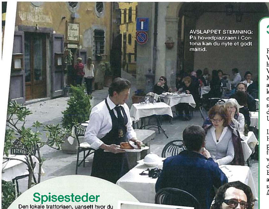
AVSLAPPET STEMNING: På hovedpiazzaen i Cortona kan du nyte et godt måltid.