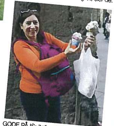
GODE PÅ IS: Italienerne elsker sin gelato, og i Toscana hevdles det hardnakket at iskremen ble skapt nettopp her.