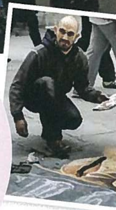
GATEKUNST: Sienas mange gateartister holder ofte et høyt kunstnerisk nivå, og reproducerer kjente kunstverk.

✓ Mange restauranter, ofte de som retter seg mot turister, stenger også på vinteren. Den lokale trattoriaen er derimot alltid åpen, og her har du også god anledning til å komme tettere på lokalbefolkningen. Lær deg noen gloser italiensk, det kommer du langt med!